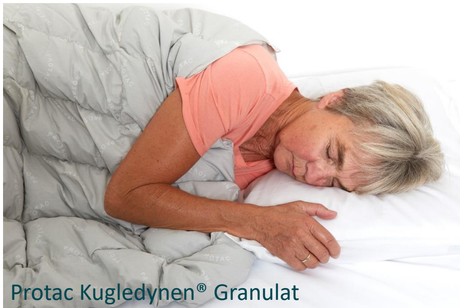
Protac Kugledynen® Granulat

Pilotprojektet dokumenter den beroligede virkning af Protacs produkter hos borgere med demens